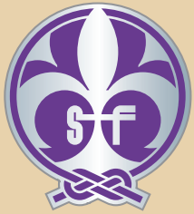
insigne fédéral de promesse